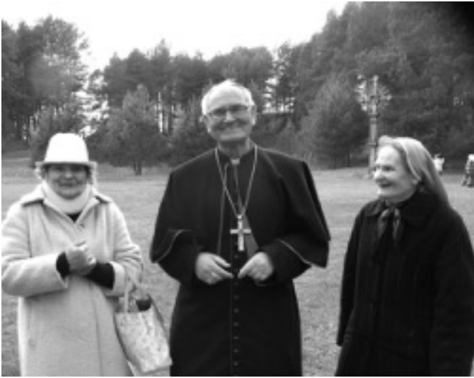
Didžiosios kovos apygardos partizanų parke.